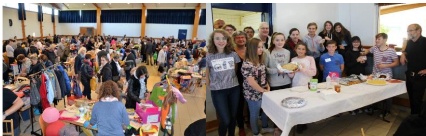
Beaucoup de monde et une belle équipe pour organiser !

Lors d'une prochaine réunion du CME les enfants choisiront l'association caritative bénéficiaire cette année.